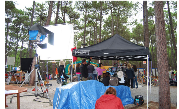
Tournage du film Camping 2 en FD de la Teste (33)