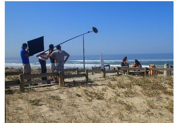
Tournage du film Papy Sitter en FD Dunes du Sud (40)