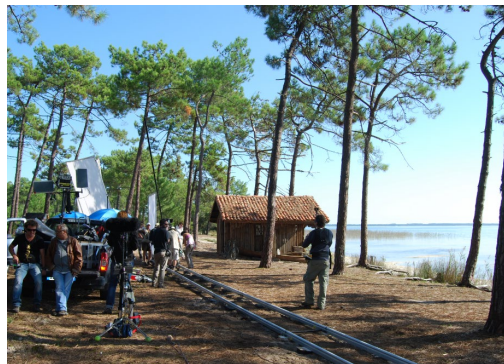
Film Thérèse Desqueyroux en FD d'Hourtin (33)